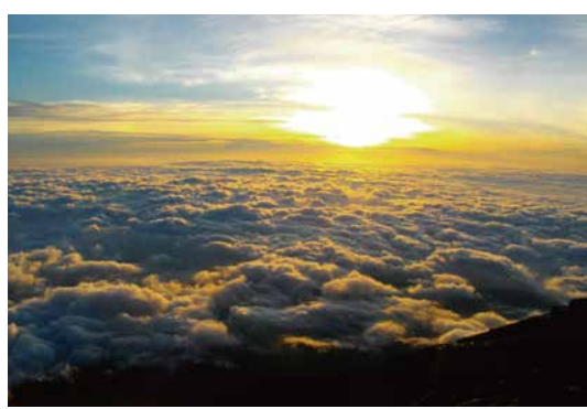
山小屋からのご来光（八合目付近）

●最新の富士登山情報は、富士登山オフィシャルサイトで確認を。 www.fujisan-climb.jp